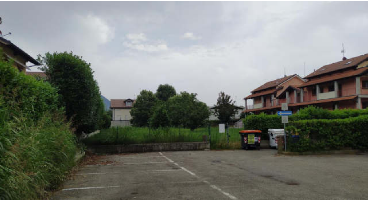
immagine 1 – foto accesso da parcheggio