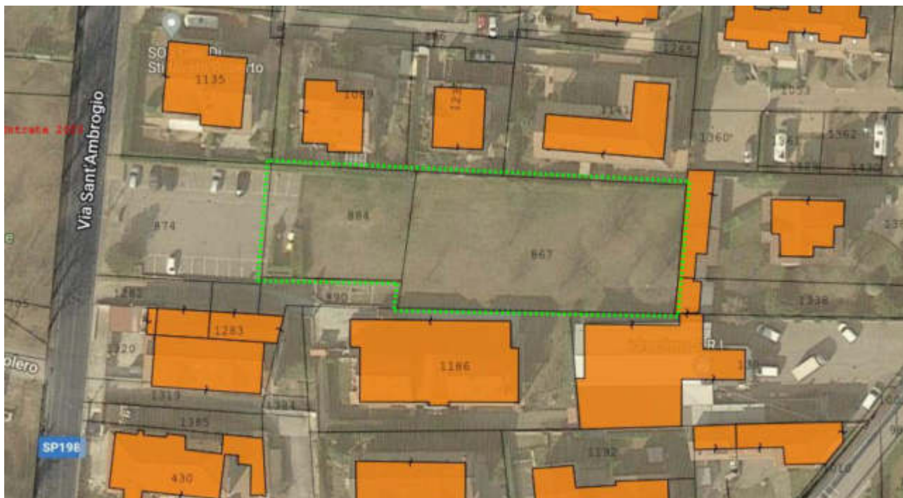
immagine 3 – sovrapposizione (approssimativa) della mappa catastale alla vista satellite

Ai fini della presente perizia, non sono stati eseguiti rilievi per la verifica delle superfici e/o dei confini, in quanto non richiesto. Si rende noto che la sovrapposizione della mappa catastale alla vista satellitare, evidenzia un’occupazione della particella 884, nella sua porzione iniziale, con parcheggio ed area ecologica, per una profondità stimata di circa 6 mt. In caso di vendita del terreno, l’area pubblicamente utilizzata si dovrà arretrare lungo la corretta dividente di confine, salvo diversi accordi tra le parti.