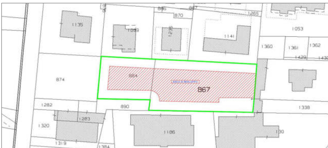
immagine 5 - area di inviluppo